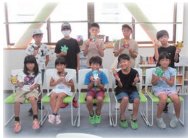
・夏休みアイロンビーズでキャラクターをつくろう