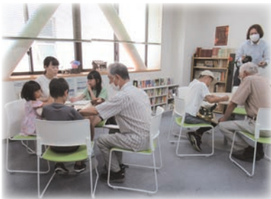
・夏休み宿題カフェ