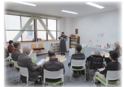
・秋の「TUNAGARU」コンサート